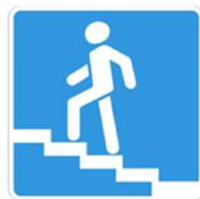
Надземный пешеходный переход