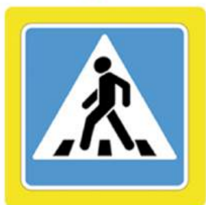
Наземный пешеходный переход